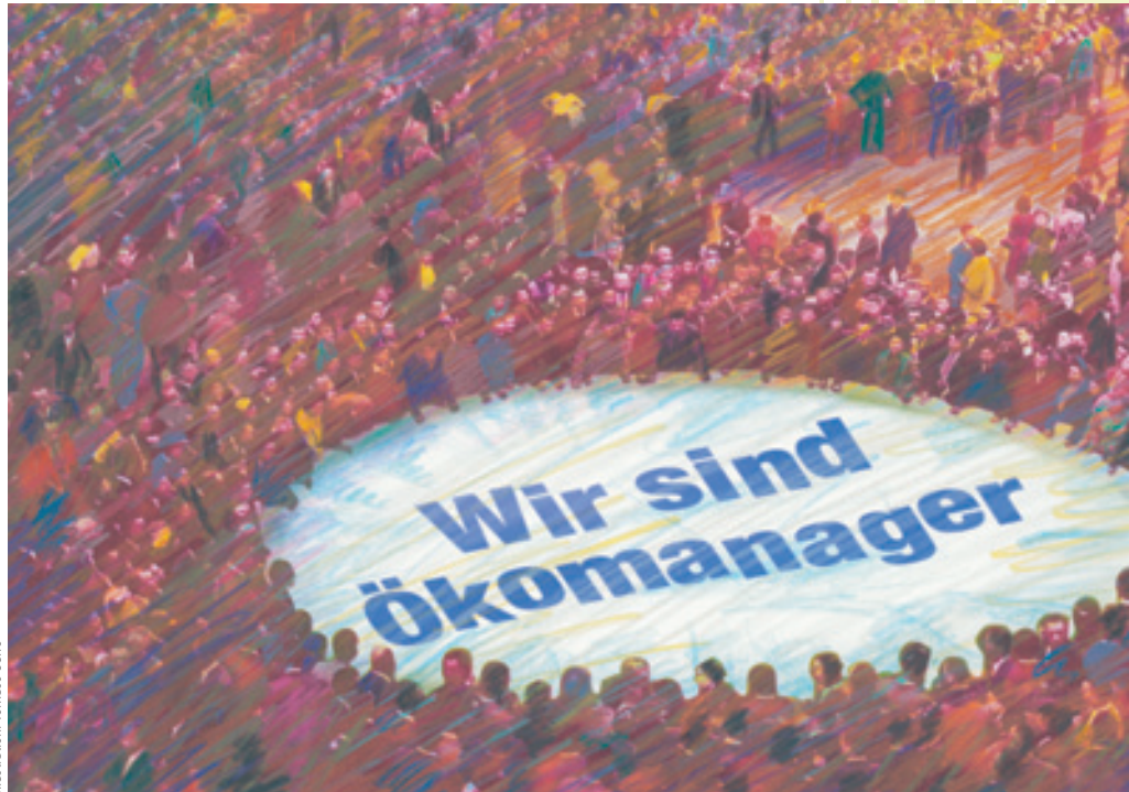
Illustration: Tommaso Serio

Eine Auszeichnung, die Kunden wie Mitarbeitern gebührt: LichtBlick stellt den Ökomanager des Jahres 2006.