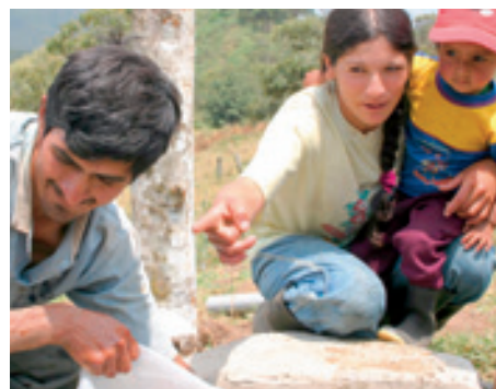
Fischzucht – Kleingewerbe bieten Lebensperspektiven.

tobt ein Streit um Kupfervorkommen. Bereits seit Jahren wehren die Menschen hier ausbeuterische Minenfirmen ab. Der Konflikt spitzt sich kontinuierlich zu: Obwohl 95 Prozent der Bevölkerung gegen den Bau von Minen sind, hat die korrupte Regierung erste Konzessionen vergeben. Jetzt setzen die Unternehmen die Bevölkerung mit Korruption, Einschüchterung und illegalem Eindringen massiv unter Druck. Dass die Einwohner sich gegen den kurzfristigen, wirtschaftlichen Gewinn und für einen langfristigen Aufbau der Region unter Integration des Klimaschutzes entscheiden, ist nicht zuletzt Resultat der Aufklärungsarbeit im Rahmen des Projekts von LichtBlick, das vor Ort von „Geoschützt den Regenwald e.V.“ unterstützt wird. Heute fürchten die Menschen Umweltzerstörung und soziale Verelendung. Sie fordern Bürgerbeteiligung, die Einhaltung bestehender Gesetze und die Gewährleistung des Umweltstandards. Gerade vor diesem Hintergrund sind die Entwicklungsarbeit in den Dörfern und die Ausdehnung der geschützten Waldflächen von größter Bedeutung.