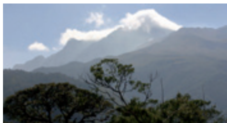
Pro Monat und Kunde wächst das LichtBlick-Schutzgebiet im ecuadorianischen Regenwald.

Mit Beharrlichkeit und pädagogischem Geschick feiert das Umweltschutzprojekt von LichtBlick in Ecuador Erfolge.