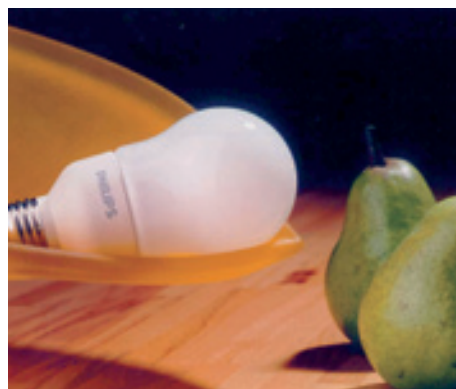
Eleganter Stromsparer: Die neuen Energiesparlampen sehen nicht nur gut aus, sie benötigen darüber hinaus fünfmal weniger Strom als die veraltete Glühbirne.

Die neue Generation von Energiesparlampen ist der klassischen Glühlampe um Lichtjahre voraus.